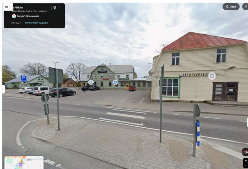
Kasutatud Google tänavavaateid (Google.com/maps)

Kokkuvõtvalt saab öelda, et nii ajaloolisel kui ka uushoonestusega ärimaadel on täisehituse protsendid ja hoonestustihedused pigem suuremad kui kavandatud lahenduses nagu ka hoone kõrgus ning korruselisus.